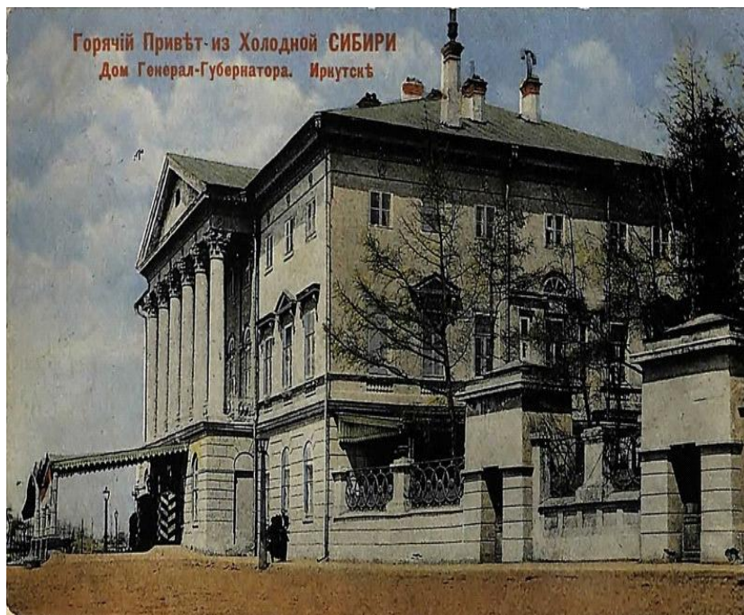
Рис 2. Дом иркутского генерал-губернатора

Идея распределения земельных участков в Иркутском генерал-губернаторстве и Приамурском крае для бывших военнослужащих после окончания русско-японской войны 1904 – 1905 гг. получила поддержку на государственном уровне и имела ряд важных правил. (Рис. 2)