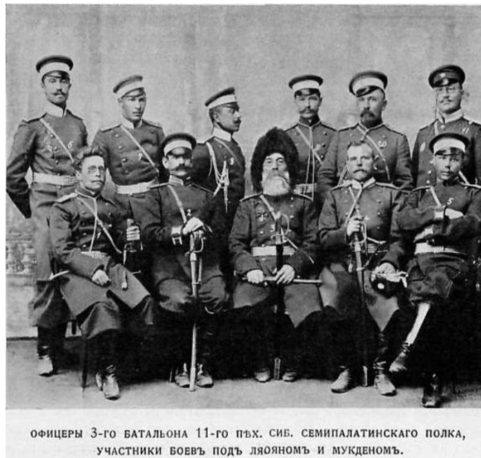
Рис. 3 Офицеры маньчжурской армии