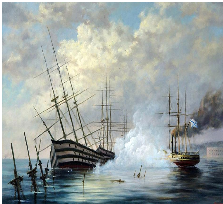
Рис. 1 Флот затопленный в Севастополе.

В благотворительности для нужд армии и флота приняли активное участие представители императорской семьи, [1] дворянства, [2] купечества, мещанства. [3] Отдельное место среди благотворителей занимали крепостные крестьяне, находившиеся практически в бесправном положении на всей территории Российской Империи. [7] (Рис. 1)