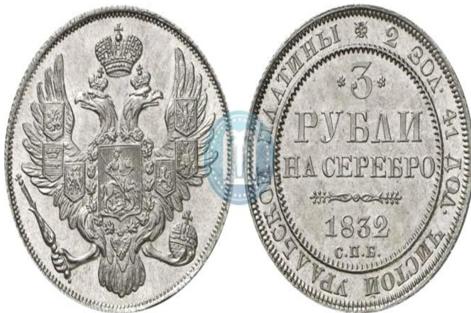
Рис. 3 Три рубля серебром

Случались во время Крымской войны (1853 – 1856 гг.) и коллективные денежные пожертвования от крепостных крестьян. [12, р. 22]. Кстати, пожертвования продолжались и после завершения боевых действий. Например, в 1859 г. на нужды русского флота поступили следующие денежные средства: