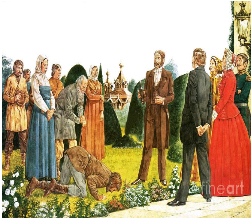
Рис. 2 Крепостные крестьяне.

Еще более разнообразными были различные предметы, пожертвованные крепостными крестьянами в 1855 г. для Российского Императорского флота: